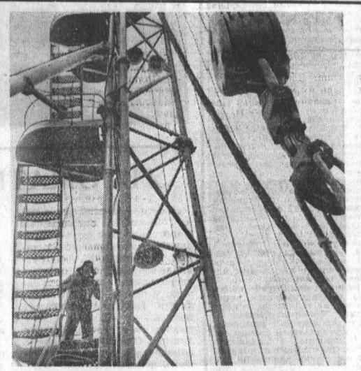
Немногом более двух лет назад в Белорусии была получена первая нефть. Сейчас в республике идет интенсивное освоение нефтяных месторождений. НА СНИМКЕ: монтаж буровой.