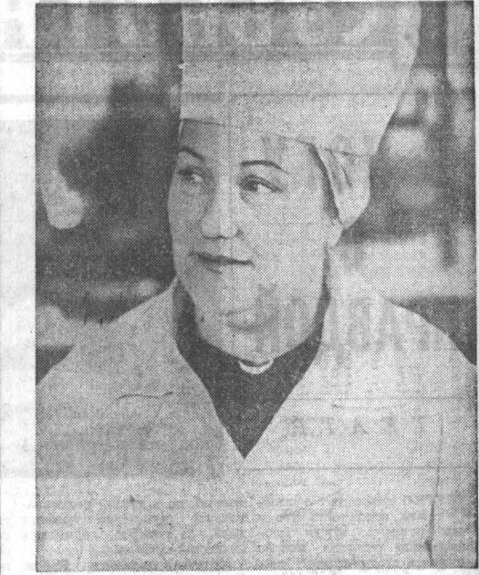
В кафе-террасе магазина № 2 горничная всегда большой выбор бутербродов, булочек, пирожков, постоянно в продаже молоко, сметана и, разумеется, любимое блюдо большинства посетителей — горячие сосиски с зеленым горошком.

Лишь в конце 90-х годов под давлением общественности запрет с «Капитала» был снят, и вышло несколько его изданий.