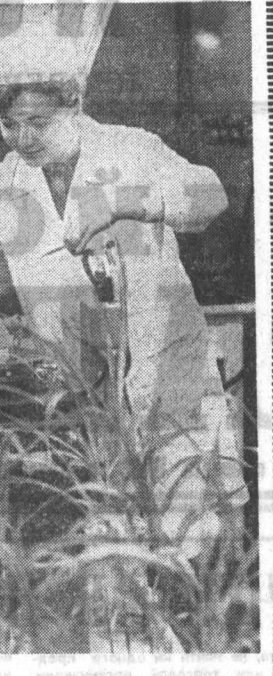
МОСКВА. Сельскохозяйственная академия имени К. А. Тимирязева является первым в нашей стране учебным и научным учреждением, где начались работы по применению атомной техники в сельском хозяйстве.