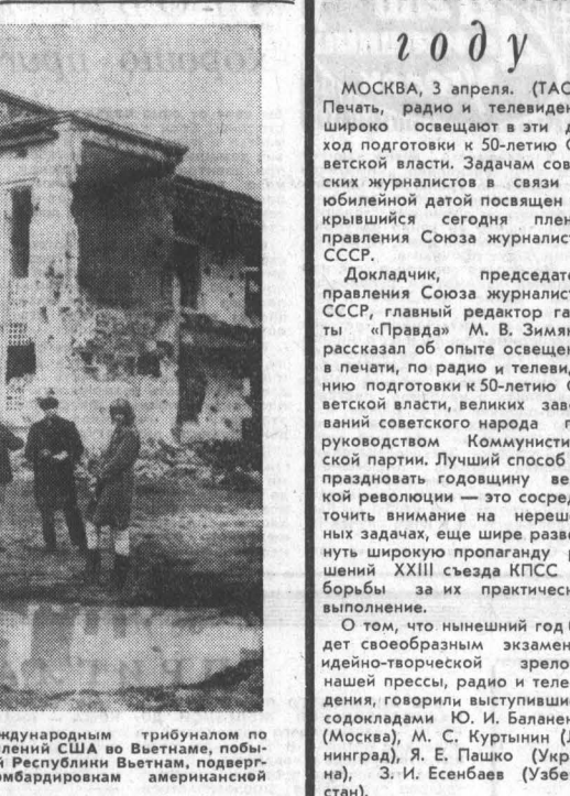
Члены группы, посланной Международным трибуналом по расследованию военных преступлений США во Вьетнаме, побывали в районах Демократической Республики Вьетнам, поддерживая наиболее варварским бомбардировкам американскими авиационными группами.

Хуэйбиньшиские газеты почти полностью посвящены «разоблачению» и «осуждению» преступлений председателя КНР Лю Шяо-ци. Газета «Шоуду хуэйбиньши» организовала вчера экстренный митинг, в котором призывает немедленно организовать новую конференцию представителей хуэйбиньши в Пекине, в котором призывает немедленно организовать новую конференцию представителей хуэйбиньши в Пекине, в котором призывает немедленно организовать новую конференцию представителей хуэйбиньши в Пекине.