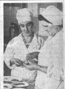
«НАШ ОБЩЕСТВЕННЫЙ СТОЛ» — новая рубрика в газете. В этом разделе в дальнейшем будут помещены материалы и снимки, рассказывающие о работе столовых, кафе, ресторанов и домовых кухонь, будут печататься зарисовки и очерки о переменах общественного питания.

Переходящие Красные знамена Министерства сельского хозяйства СССР и ЦК профсоюза рабочих и служащих сельского хозяйства и первые денежные премии присуждены колхозам имени Карла Маркса Кытмановского, «Заветы Ильича» Поспелихинского, «Россия» Шинуровского районов, совхозам «Кубанка», «Курьинский», «Прутской», «Чистоньский» Алтайского края.