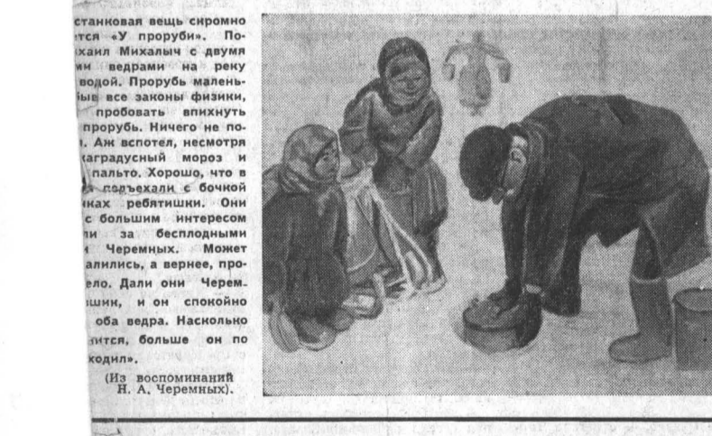
станковая вещь сиромно... (Из воспоминаний Н. А. Черемных).

МАРТ по календарю — первый весенний месяц. В большей части страны, в том числе и в Западной Сибири, среднедневная температура в марте стоит ниже нуля. Но уже заметно поднимается день, солнце поднимается выше над горизонтом, днем часто бывает оттепель, а ночью снова подмораживает. Существует понятие — ранняя или поздняя весна. В от- ИДЕТ ВЕСНА-КРАСНА! дельные годы температура в марте отклоняется от средней на значительные величины. Например, в Барнауле среднедневная температура была в 1860 году 19 градусов мороза, а в 1893 году — лишь четыре градуса. Каким же будет март в этом году? По данным Гидрометцентра, среднедневная температура в Алтайском крае ожидается 11-15 градусов, это на 2 градуса холоднее многолетней температуры. Месячное количество осадков будет 5-10 миллиметров. На юго-западе 10-12 миллиметров. Такое количество меньше нормы, на юго-западе края — больше нормы. С 11 по 17 и с 22 по 24 марта ожидается в крае местами осадки преимущественно в виде снега, в начале второй декады — мокрый снег. В остальное время малооблачная погода без осадков. Холодно будет в начале первой, начале второй декады и около середины месяца. В это время ночные температуры будут достигать 27-32 градусов мороза. Наиболее теплые дни будут 12-14 марта и в последней пятнадцатке. Температура в это время будет достигать 4-9 градусов тепла. В остальное время средняя температура не поднимется ниже 14-19 градусов мороза, днем 5-10 мороза. Н. КОЗЛОВСКИЙ, начальник метеорологической станции г. Барнаул.