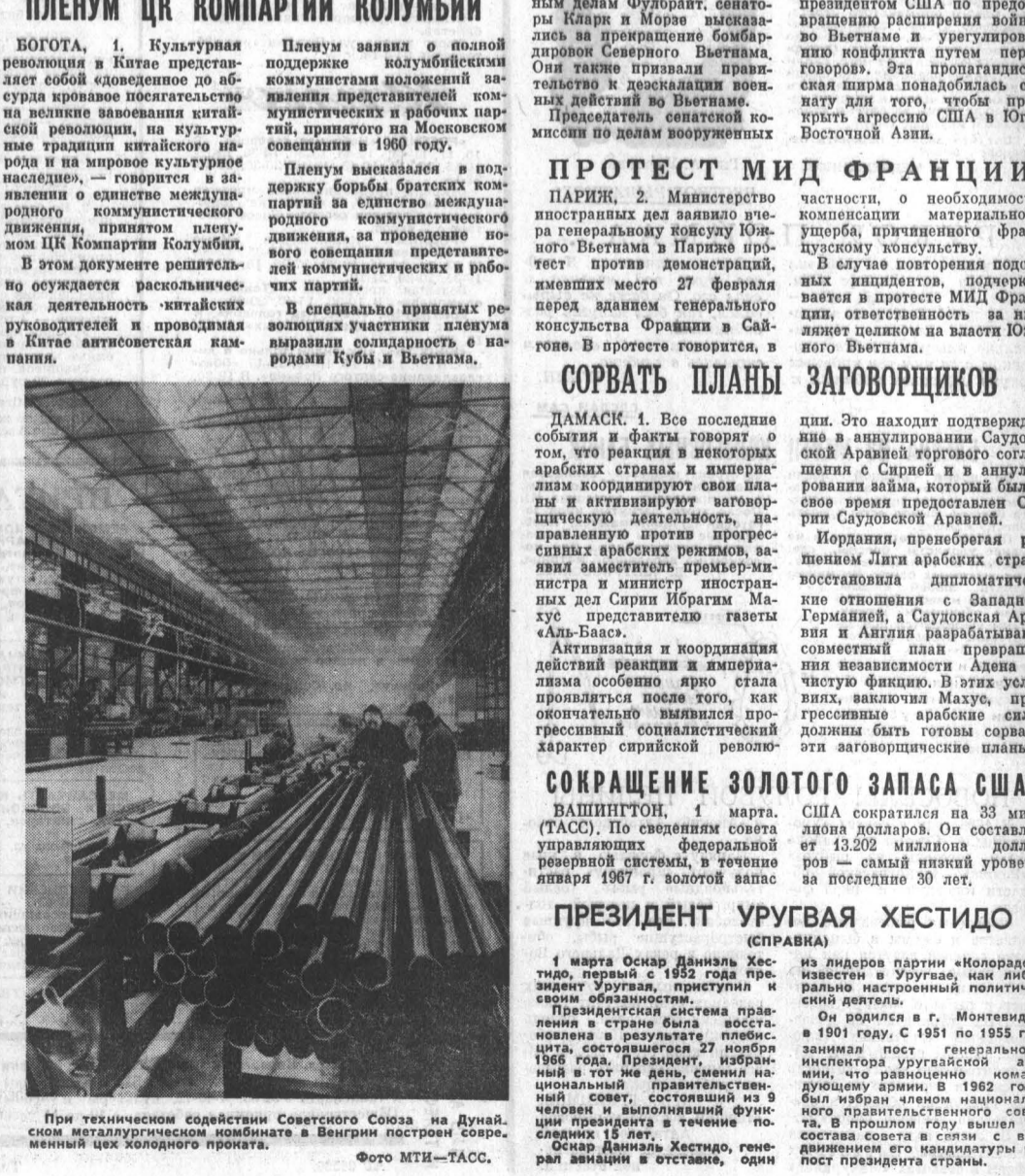
При техническом содействии Советского Союза на Дунай, сном металлургическом комбинате в Венгрии построен соврешенный цех холодног проката.

Оскар Даниэль Хестидо, генерал-авианин в отставке, один из лидеров партии «Колорадо», известен в Уругвае, как либерально настроенный политический деятель. Он родился в г. Монтевидео в 1901 году. С 1951 по 1955 год занимал пост генерального секретаря избранным парламентом, что равносильно командующему армией. В 1962 году был избран членом национального совета в составе сессии в связи с выдвинутым его кандидатурой на пост президента страны.