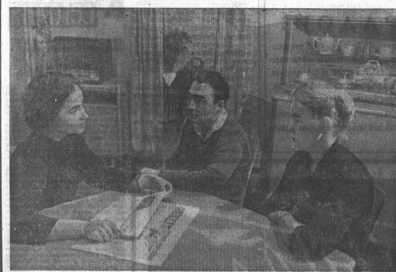
Двадцать восемь агитаторов центральной усадьбы совхоза «Комсомолец» Павловского района в предвыборные дни проводят большую работу с избирателями, беседуют с ними о последних событиях в стране и за рубежом, о совхозных делах, рассказывают о советской демократии, правах и обязанностях граждан СССР.

На днях жители села Кадинково Мамонтовского района в клубе с интересом знакомыми с очередным номером устного журнала.