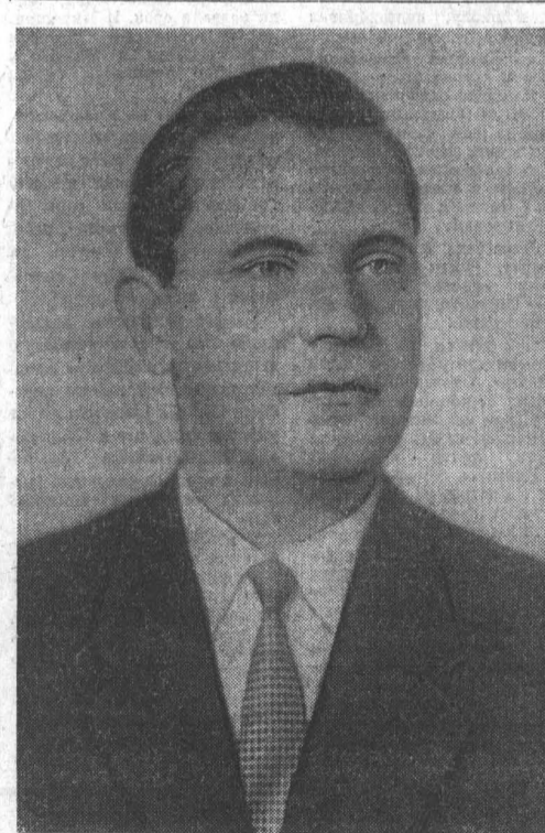
Д. С. ПОЛЯНСКИЙ