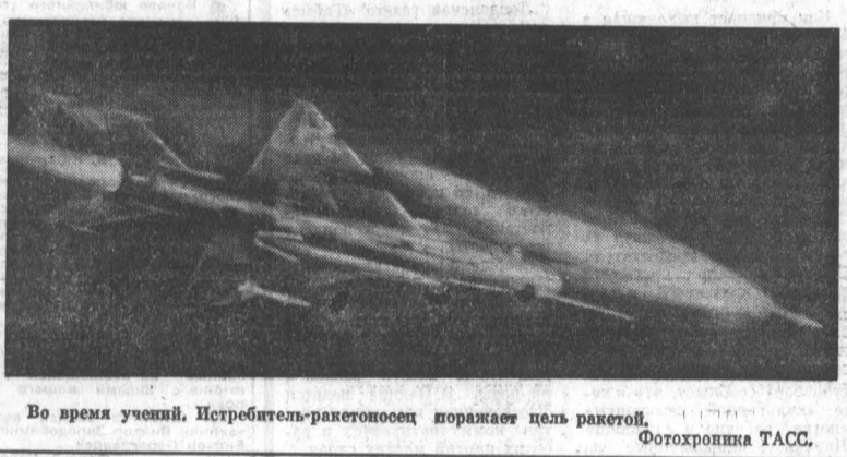
Во время учений. Истребитель-ракетноосец поражает цель ракетой.