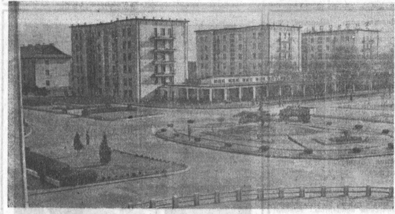
КОРЕЙСКАЯ НАРОДНО-ДЕМОКРАТИЧЕСКАЯ РЕСПУБЛИКА. Одна из площадей в Ханое.

В первый день перемирия американские войска несколько раз нарушили перемирие в провинции Тайнинь. Так, американская авиация обстреляла две деревни во время празднования китайского лунного нового года. Американские каратели пытались также сорвать праздник жителей деревень Сюкьет и Лого, но были вынуждены отступить под ударами Армии освобождения Вьетнама. Агентство ВИА указывает, что войска Армии освобождения Южного Вьетнама строго соблюдают объявленное перемирие, но готовы дать отпор в случае его нарушения американскими войсками.