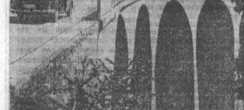
ЮГОСЛАВИЯ. Часть Адриатического магистрала, протянувшаяся вдоль всего морского побережья от крупнейшего на севере югославского порта Риеки до строящегося на южной Адриатике порта Бар. От Бара автострада будет продолжаться через Черногорно до Сплита. Длина всей магистралы — 1.900 километров.

НЬЮ-ЙОРК, 9 февраля. Четвертый день продолжает полет автоматическая космическая станция «Лунар орбитер-3» в сторону Луны. По сообщениям из Пасадены, «Лунар орбитер-3» после корректировки вышел на заданную орбиту. Целью полета «Лунар орбитер-3» — сфотографировать предполагаемые места посадки космонавтов на Луне.