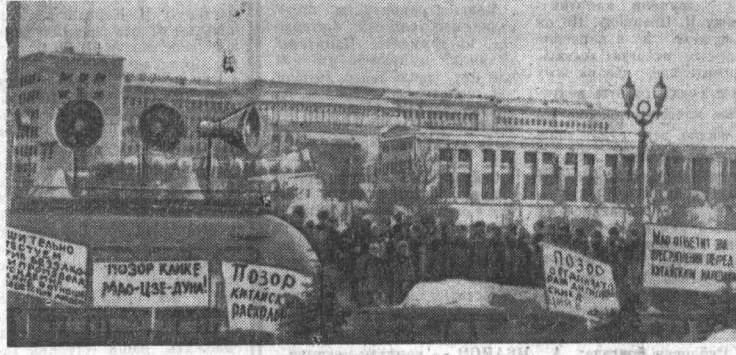
Делегации трудящихся столицы у посольства КНР в Москве. Они пришли, чтобы вручить резолюции митингов протеста против антисоветских провокаций в Пекине. (Снимок принят по фототелеграфу). Фотохроника ТАСС.

В Москве проходит митинг протеста против разнузданных антисоветских действий, организуемых кликой Мао Цзэ-дуна. Выражая волю их участников, выделенные на митингах делегации предприятий, учреждений, вузов направляются в посольство КНР, чтобы вручить принятые резолюции.