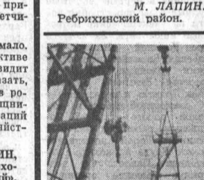
БАКУ. Эта 40-метровая буровая вышка, которую так легко поднять кастрированные богатые, — иранское судно-катамаран «Кероглы» весит 20 тонн. 24 января катмаран перенес эту вышку с одного из морских оснований нефтепромышленного управления имени Серябровского на новый стальной островок. Операция длилась всего несколько часов. Прежде для транспортировки вышку демонтировали, затем собирали на новом месте и тратили на такую операцию 14—15 суток.