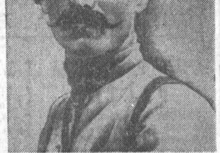
Белогвардейскими войсками Колчака на Восточном фронте.

С апреля 1919 года Чапаев назначен командиром 25-й стрелковой дивизии, где комиссаром был Д. А. Фурманов. Дивизия покрыла себя неуязвимой славой в боях с