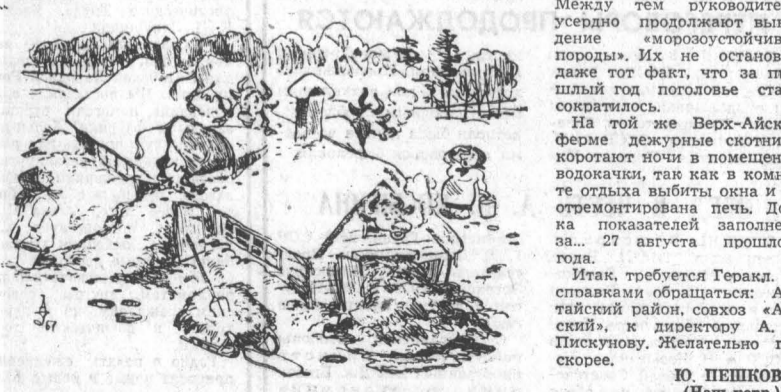
Рис. А. Урюкина.

Ю. ПЕШКОВ, (Нап. корр.) Алтайский район.