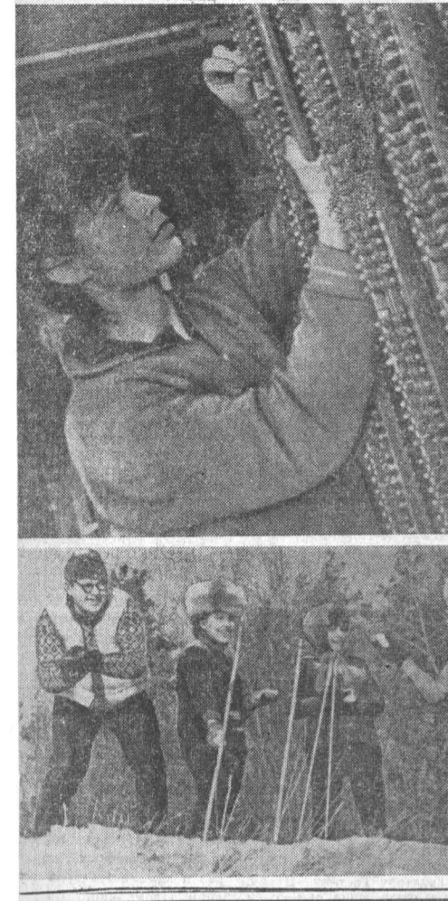
Продолжение. Начало в № 20.