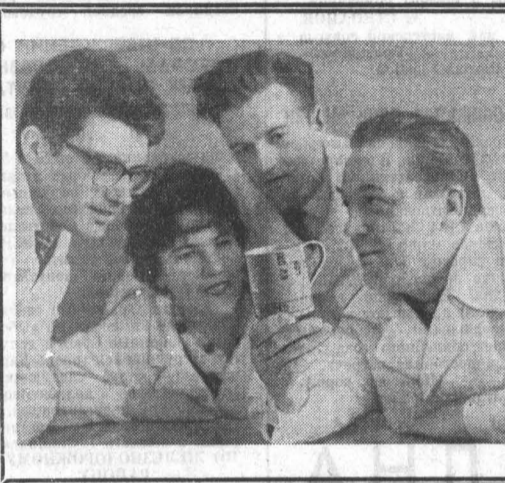
Каждой отрасли быть рентабельной