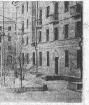
По утрам, когда рассвет еще едва прорезается над степью, город уже живет полноценной жизнью. Деловито накатываются автобусы, распахиваются двери заводских проходных, тысячи людей спешат на работу.

нужно сдавать не менее пятидесяти тысяч квадратных метров жилья, строить по одной школе, три—четыре детских учреждения. В этом пятилетии будет построено крупнейший в городе университет на двести рабочих мест. К пятидесятилетию Советской власти строители сделают расширение его сети. Будет достраиваться больничный городок. Каждый год