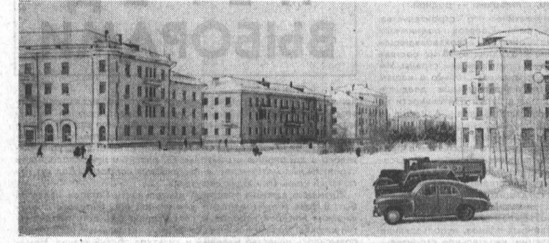
По утрам, когда рассвет еще едва прорезается над степью, город уже живет полноценной жизнью. Деловито накатываются автобусы, распахиваются двери заводских проходных, тысячи людей спешат на работу.

По утрам, когда рассвет еще едва прорезается над степью, город уже живет полноценной жизнью. Деловито накатываются автобусы, распахиваются двери заводских проходных, тысячи людей спешат на работу. Сейчас в Рубцовске десятки тысяч рабочих, несколько крупнейших заводов, надела руб рубцовчан знает почти весь мир. А ведь двадцать пять лет назад самым крупным предприятием города было локомотивное депо... Постоянно гудит паровозный свисток, на который только советские люди! И все эти предприятия, детские сады и школы созданы руками строителей треста № 46. Сегодня он справляет свой юбилей. Прожить в этот день по улицам города, и успехи строителей предстанут перед вами в наглядном виде. Жилые дома и кинотеатры, больницы и клубы, просторные магазины и детские учреждения — вот далеко не полный перечень того, что сделано им. За свои 25-летнее суще-