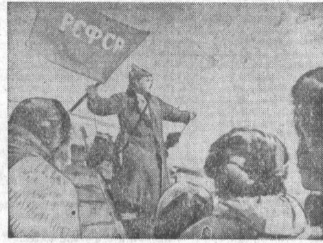
Кадр из фильма «Первороссиенцы»