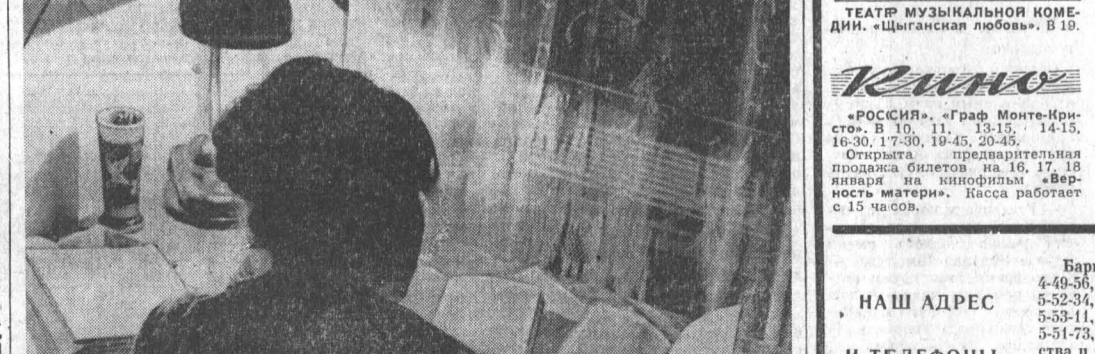
Завтра — зачет...