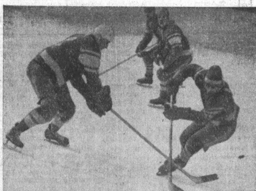
НА СНИМКЕ: момент игры.