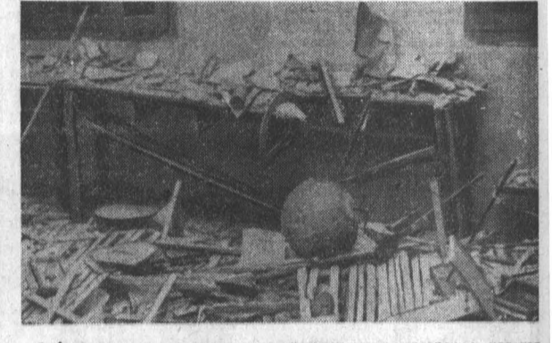
Американские агрессоры не прекращают своих варварских налетов на Демократическую Республику Вьетнам. Их бомбы падают на мирные города и села, убивают женщин и детей. НА СНИМКЕ: в помещении средней школы на окраине Ханоя после влета американских бомбардировщиков.

В заключение НФО призывает весь народ и вооруженные силы Южного Вьетнама в 1967 году добиться полной победы над врагом.