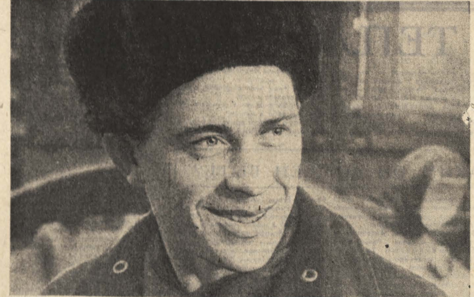
За девять месяцев этого года коллектив Озерского опытно-показательного леспромхоза дал сверх плана много древесины, хвойно-витаминной муки и мюсли...

Год издания 50-й. ВОСКРЕСЕНЬЕ, 23 ОКТЯБРЯ 1966 г. Цена 2 коп.