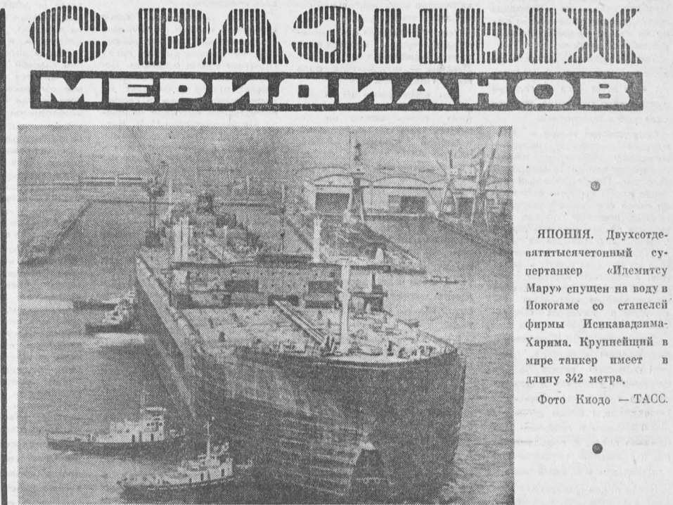
ЯПОНИЯ. Двухсотсороклетний супертанкер «Идемитсу Мару» спущен на воду в Йокосаге со стапелей фирмы Исихавадзима-Харима. Крупнейший в мире танкер имеет в длину 342 метра.

Г АСТРОЛИ СОВЕТСКОГО ЦИРКА В Работе начались гастроли советского цирковой труппы. Советские артисты выступают со специальной программой «Цирковые игры». Большая программа была показана уже в марокканских городах Ужда, Мекнес, Фес и Кенитра. Представления прошли с большим успехом.