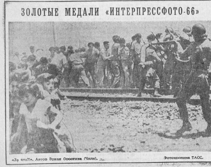
«За что?». Автор Эдвард Орсогима (Чили).

Итак, мода 1968 года. Какой она будет? Второе рождение хлопчатобумажных тканей. Как всегда, моден хлопок — традиционные ситцы, сатины, поплины. Лаковой формы современной одежды очень соответствует, например, структура ткани «Ромашка» Ташкентского текстильного комбината.