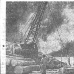
Утро на нижнем склоне.