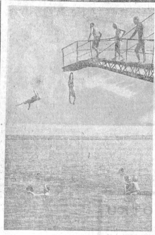
Тысячи трудящихся районного центра Владивостока в выходной день бывают в излюбленных местах отдыха. Многие устремляются к озеру Куликовскому и к водохранилищу, где на пляже можно позагорать, покататься, а семьям попытаться с вышки. Мамыт к себе прокладой

Интересные встречи пришло нам театральное лето. На сцене краевого драматического театра еще шла последние спектакли Кулагина, а на афишных щитах заперестали звучные названия украинских пьес: «Дай сердцу волю — заведет в неволю», «Ой, не ходи, Грицю...», «Не судьба».