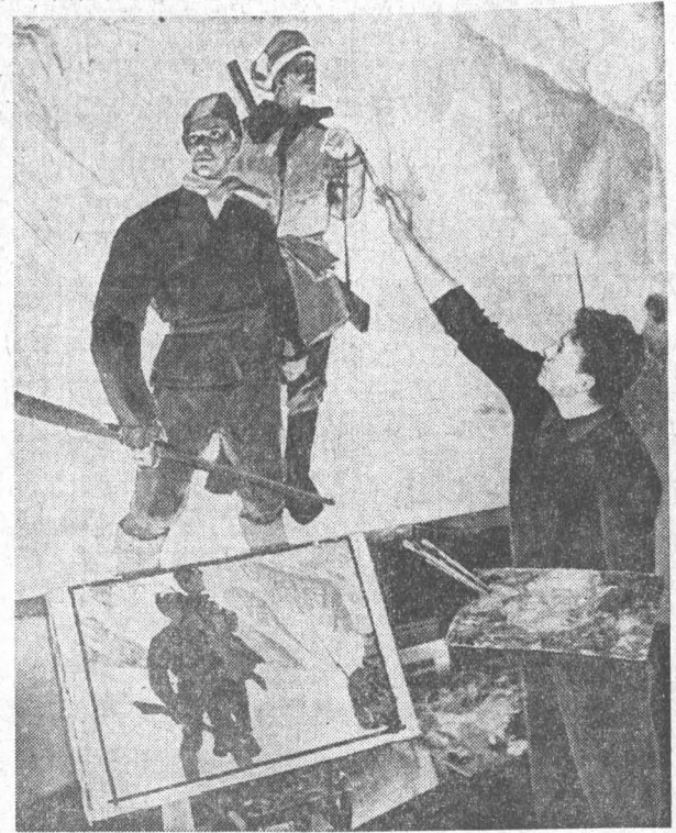
Художники Алтая готовятся к зональной выставке 1967 года...