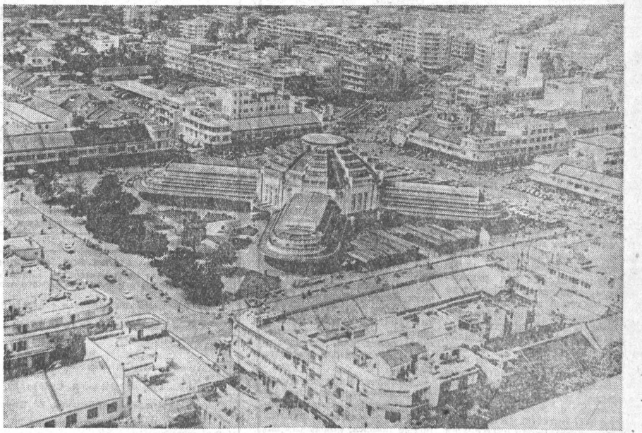
Камбоджа. Пном-Пень. В центре — Новый рынок. Агентство печати Новости. 27 октября 1965 г. 3 стр.

НАЙРОБИ, (ТАСС). В аэропорт Найробы в специально захваченном самолете прибыл необычный пассажир — человек, которому от роду две недели. Необычен и история появления на свет этого обитателя адриатических саванн. Близ реки Мара в Танзании охотники преследовали самую носорога, чтобы перебраться ее в заплодородный Рубондо, расположенный на одном из островов на озере Виктория. В путь охотники они не заметили, что животное находится в последней стадии беременности. Самка носорога не выдержала потуги и сломалась. Сделав неслабые сокращения, охотники обнаружили тело детеныша. Ему было сделано искусственное дыхание, и через 10 минут детеныш ожил. Свои первые шаги он совершил на самолете двухдвухдвух пассажир перевернулся.