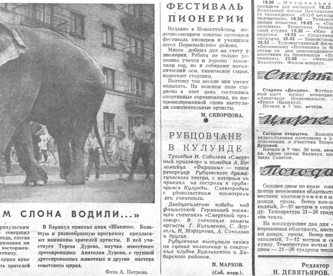
«ПО УЛИЦАМ СЛОНА ВОДИЛИ...»

Сегодня днем по краю ожидается переменная облачность, местами кратковременные дожди, грозы. Ветер юго-западный. 5—10 метров в секунду. Температура 21—26 градусов тепла.