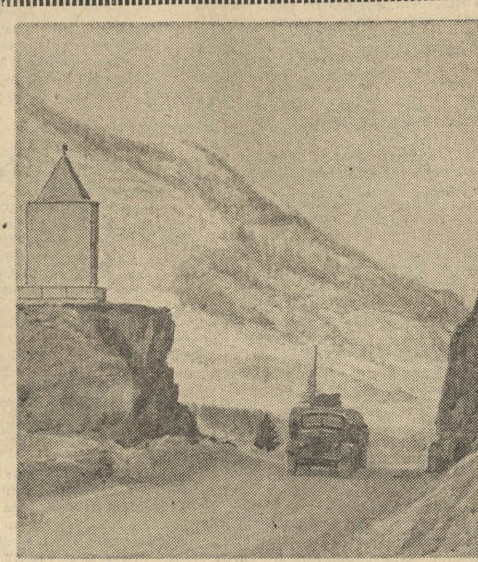
В краю голубых гор. Участок Чуйского тракта у Белого Бомба.