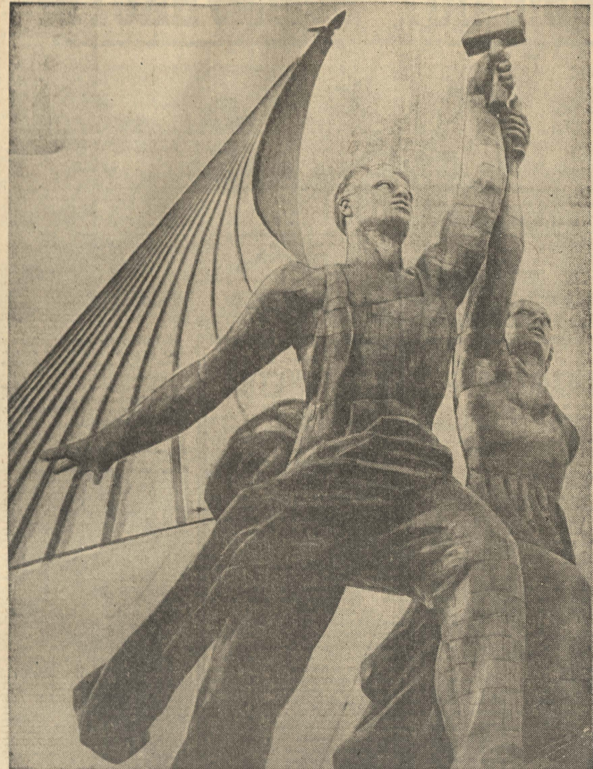
Фотомонтаж Д. Чернова.