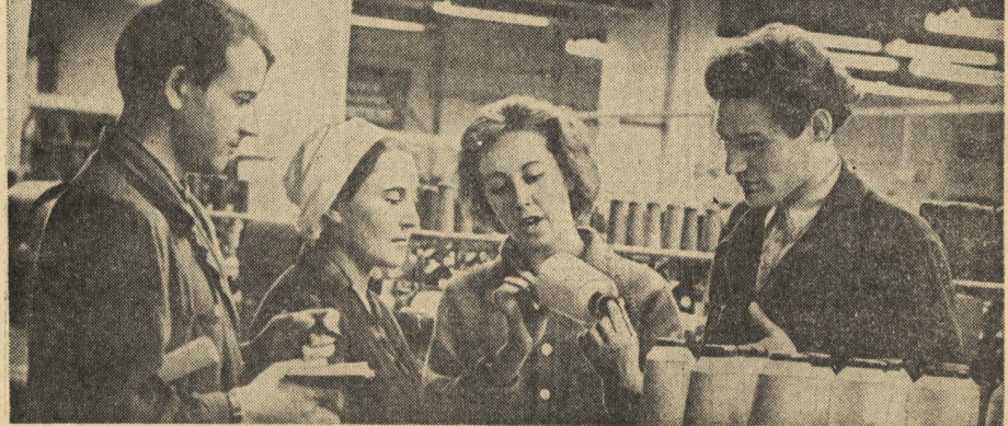
Активным творческим поиском занят весь коллектив. Люди ищут пути удорожения продукции. В этом большая заслуга принадле...