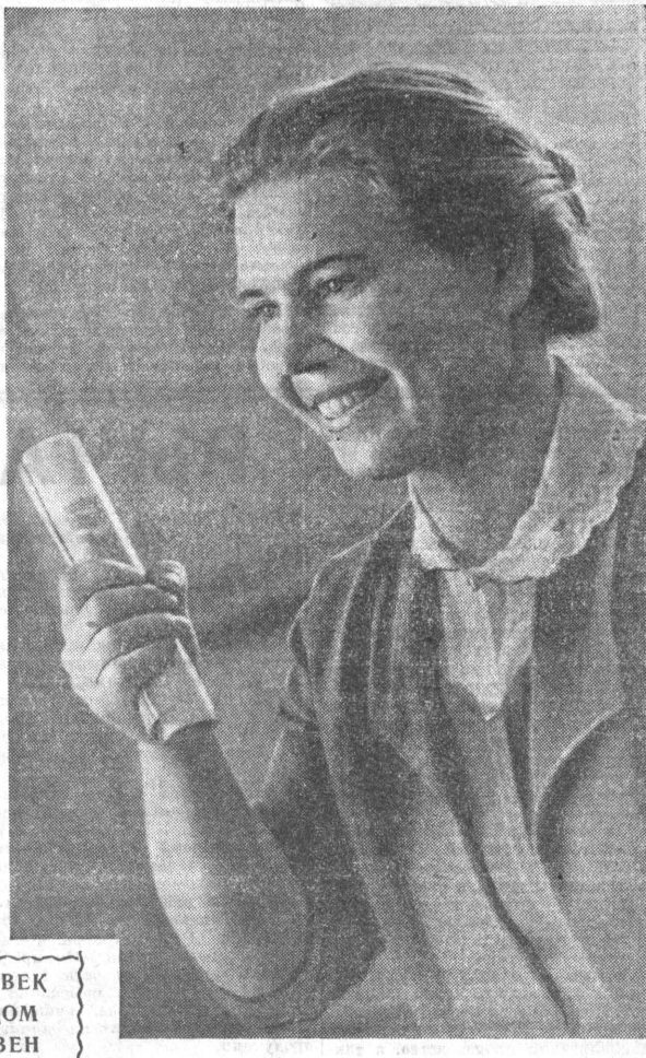
ЧЕЛОВЕК ТРУДОМ СЛАВЕН