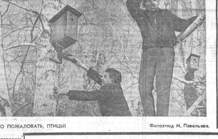
ДОБРО ПОЖАЛОВАТЬ, ПТИЦЫ!

Ф. МОИСЕНКО. г. Усть-Чарыш. Усть-Пристанский район.