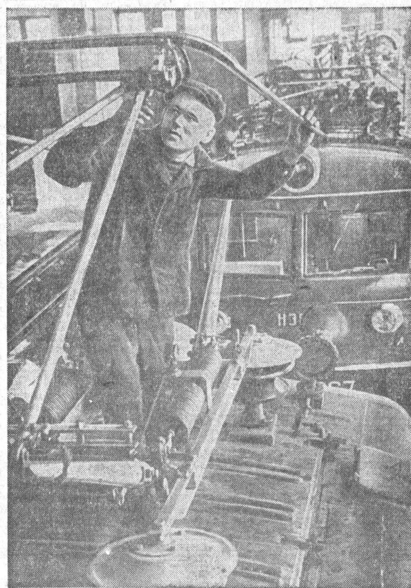
В депо станции Алтайская подведены первые итоги социалистического соревнования в честь 1 Мая. Первое место занял коллектив цеха периодического ремонта.