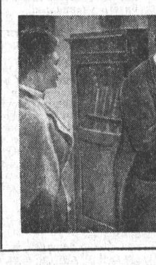
«В НАЧАЛЕ ВЕКА»