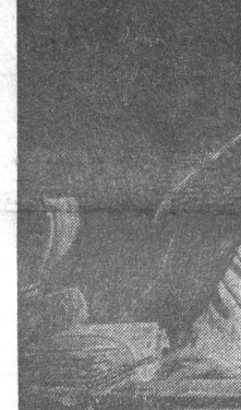
«РАССКАЗЫ О ЛЕНИНЕ»

НА СНИМКАХ КАДРЫ ИЗ ФИЛЬМОВ: «В НАЧАЛЕ ВЕКА»