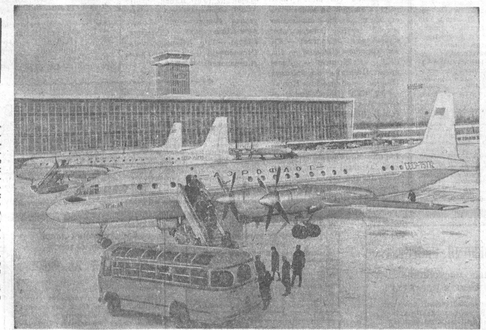
На снимке: аэропорт «Домодедов». Из очередного рейса прибыл в столицу самолет ИЛ-18.

АЛТАЙСКАЯ ПРАВДА ТАСС АПН. Москвичи и гости столицы получили к Новому году хороший подарок — вступает в строй действующих новое здание аэровокзала «Домодедов». Построенное из стекла и бетона, оно вместе с перронными галереями, к которым одновременно смогут подходить четырнадцать воздушных лайнеров, тянется почти на километр.