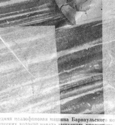
Последняя пилонная машина Барнаульского комбината химических волокон начала выпускать продукцию.