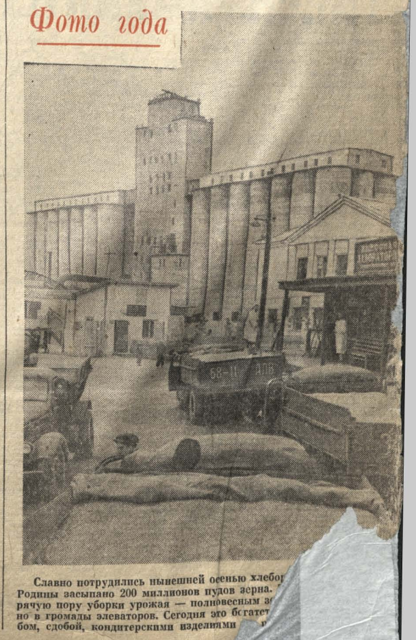
Славно потрудились нынешней осенью хлебородники Родины засыпано 200 миллионов пудов зерновой культуры — полновесный урожай в громады элеваторов. Сегодня это богатство, сдобой, кондитерскими изделиями

В. ЗАЙЦЕВ, слушатель университета рабселькора, Сорочинский район.