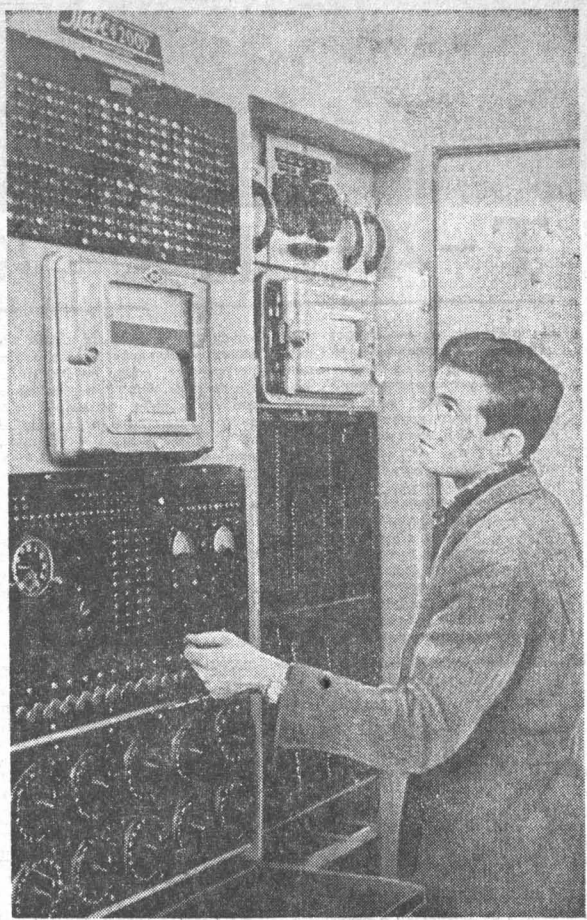
... торможения на высоте