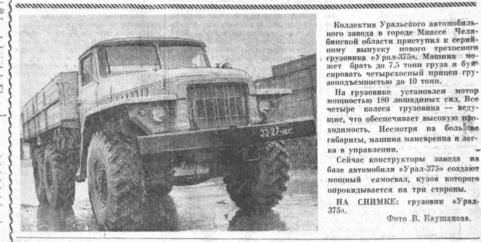
Коллектив Уральского автомобильного завода в городе Миассе Челябинской области приступил к серийному выпуску нового трехосного грузовика «Урал-375». Машина может брать до 7,5 тонн груза и перевозить четырехосный прицеп грузоподъемностью до 10 тонн.