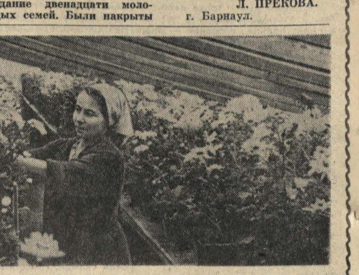
Сто тысяч цветов

За окнами — мороз, метель. А на праздничных столах сестер барнаульцев, в залах, где проходили торжественные заседания и вечера, — букеты белоснежных хризантем, горшочки с примулами, цимлянками.