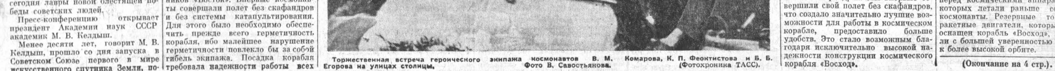
Торжественная встреча героического экипажа космонавтов В. М. Комарова, К. П. Феоктистова и Б. Б. Егорова на улицах столицы.

Если на корабле «Восход» космонавт, наблюдая то или иное явление, воспринимал его по-своему, то на «Восходе» при наблюдении подобных явлений немедленно происходил обмен мнениями, который позволял выявить факт более объективно. Так было, например, в случае наблюдения светилами частиц через иллюминаторы корабля.