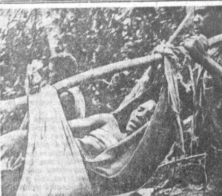
Народ Анголы продолжает героическую борьбу против португальских колонизаторов, за свободу и независимость своей родины. Несмотря на трудные условия борьбы — нехватку оружия, боеприпасов, медикаментов, отсутствие военного опыта, — отряды Народного движения одерживают одну победу за другой. Под контролем патриотов находится уже значительная территория на севере страны. На снимке: бойцы отряда Народного движения выносят раненых.