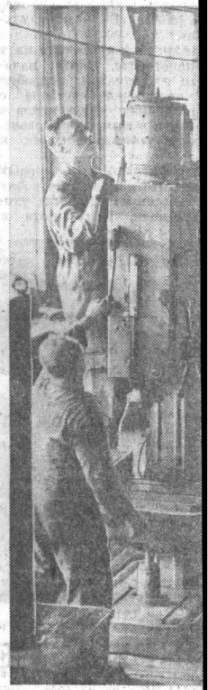
Эти станки приготовил экспорт.

СТРАНИЦА ПОДГОТОВЛЕНА СОТРУДНИКАМИ ПОСОЛЬСТВА ГЕРМАНСКОЙ ДЕМОКРАТИЧЕСКОЙ РЕСПУБЛИКИ В СССР СПЕЦИАЛЬНО ДЛЯ ЧИТАТЕЛЕЙ «АЛТАЙСКОЙ ПРАВДЫ».