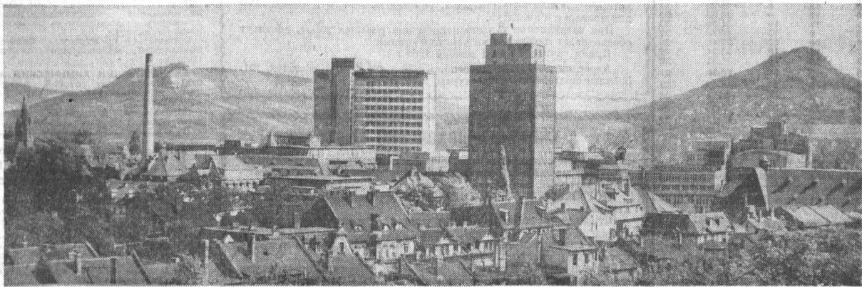
Крутые горы окружают Пену.