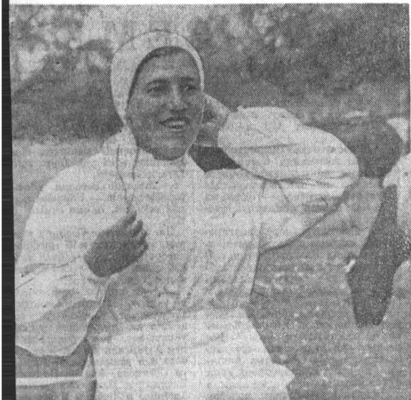
В 1970 году крупного рогатого скота в совхозе будет 7 тысяч голов. Надой планируется в 2.900 килограммов молока...

Организации круглогодичного откорма крупного рогатого скота позволяет нам успешно выполнять государственные планы производства и сдачи мяса. В нынешнем году план продаж мяса выполнен в августе — отправлено 5.800 центнеров.