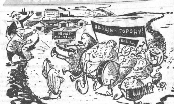
ПОД ЗВОНКУЮ МУЗЫКУ ОВОЩИ В РЯД ИДУТ ЧЕРЕДЬ БЕСКОНЕЧНО.

К вывозке овощей и картофеля привлекаются все грузовые автомобили, оставшиеся в городе. Каждая на них, независимо от того, где она работает, обязана вывезти 20 тонн овощей и картофеля.