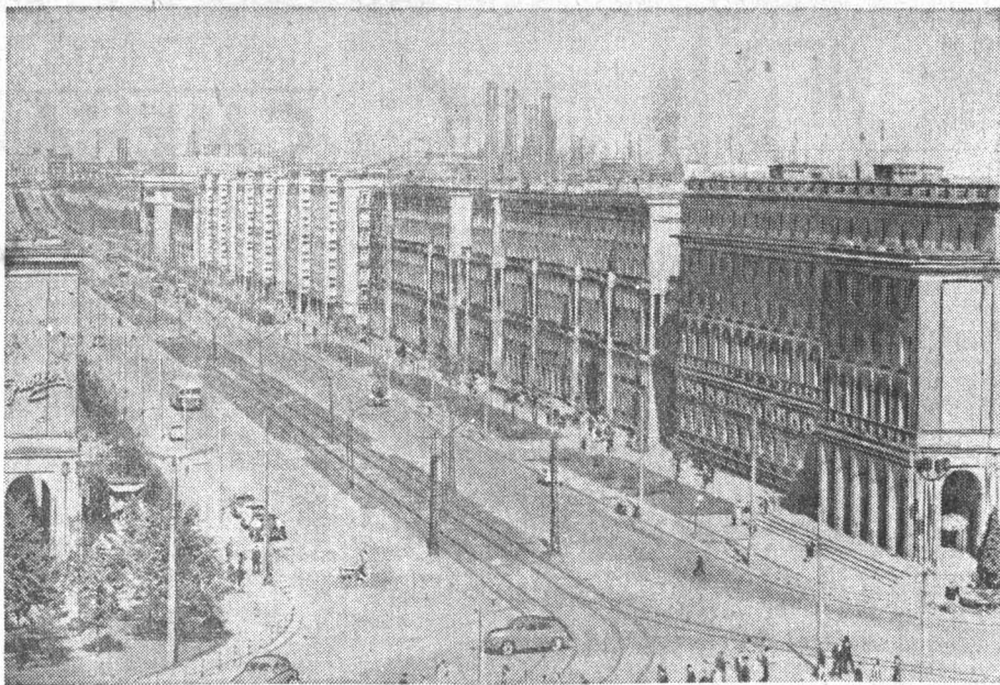
На одной из улиц Новой Гуты — центра металлургической промышленности Польши. 1964 г.