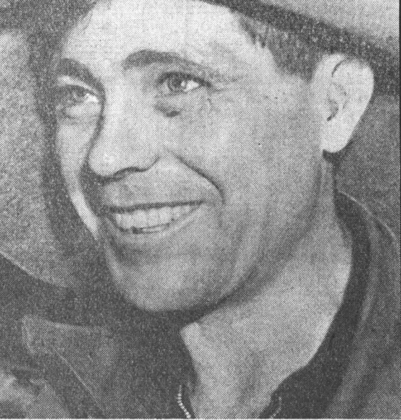
Пробита летка. Морю жару. Струится солнце в ящик ковши. Горят глаза у сталевара, Доделан он: Металл хорош! Текст А. ЖИРОВА.