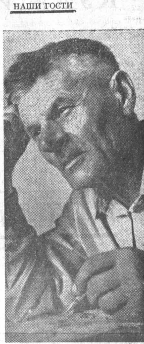
Иду и иду по магистралям. И каждый день я — гость советских людей. Вперед меня маячит зеленый цвет открытых семафоров...