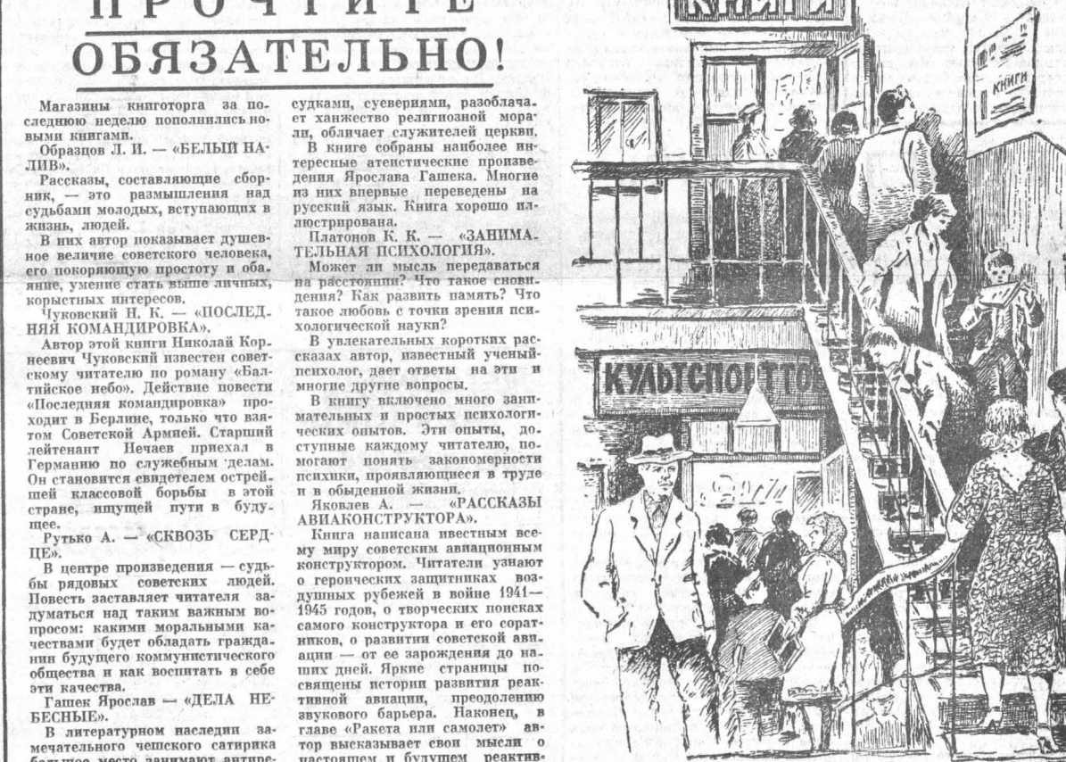
Книжный магазин на Потоке. Рис. С. Савчу

Магазины книоторга за последнюю неделю пополнились новыми книгами. Образцов Л. И. — «БЕЛЫЙ ПЛЫВ». Рассказы, составленные сборником, — это размышления над судьбами молодых, вступающих в жизнь, людей. В них автор показывает душевное величие советского человека, его покоряющую простоту и обаяние, умение стать выше личных, корыстных интересов. Чукковский Н. К. — «ПОСЛЕДНЯЯ КОМАНДИРОВКА». Автор этой книги Николай Корнеевич Чукковский известен советскому читателю по роману «Балтийское небо». Действие повести «Последняя командировка» происходит в Берлине, только что взятом Советской Армией. Старший лейтенант Печнев приехал в Германию по служебным делам. Он становится свидетелем острой,шей классовой борьбы в этой стране, ищущей пути в будущее. Рутыко А. — «СКВОЗЬ СЕРДЦЕ». В центре повествования — судьбы рядовых советских людей. Повесть заставляет читателя задуматься над таким важным вопросом: какими моральными качествами будет обладать гражданин будущего коммунистического общества и как воспитать в себе эти качества. Гашек Ярослав — «ДЕЛА НЕБЕСНЫЕ». В литературном наследии замечательного чешского сатирика большое место занимают антиреволюционные рассказы и фельетоны. Оружием сатиры писатель воеет с религиозными предрас-