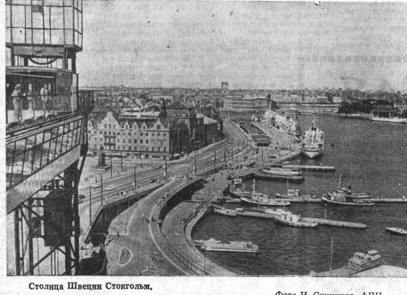
Столица Швеции Стокгольм.

июня с целью «проверки всей системы противовоздушной обороны НАТО в Центральной зоне Европы». В маневрах участвуют авиационные части Канады, Бельгии, Франции, Голландии, США, ФРГ, Англии, Италии и других стран.