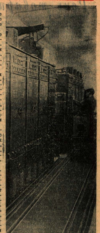
Конечная радиорелейная станция. Идет прием передач из Новосибирска.