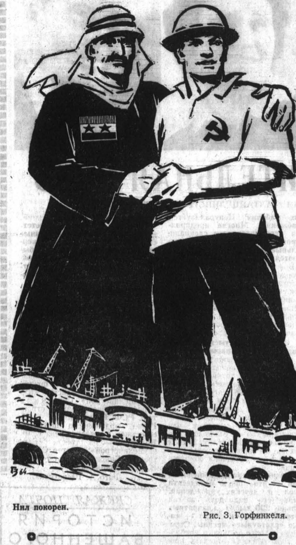
Нил покорен. Рис. З. Горфинкеля.