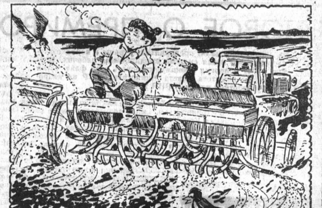
Поверхностно — перекрестный способ сева в колхозе имени Ленина.