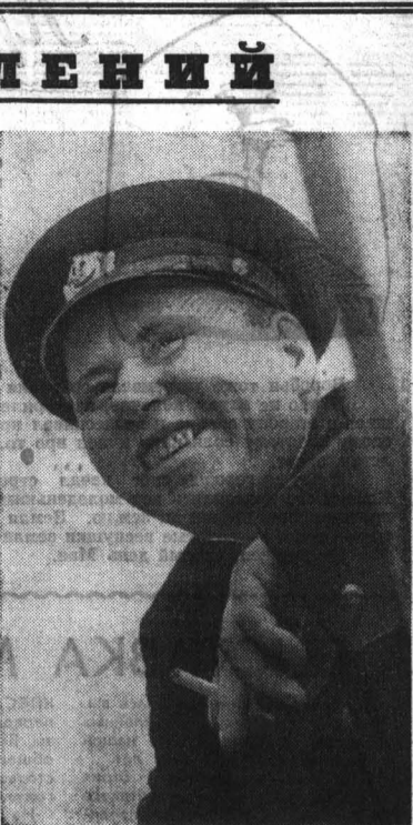
А. И. Некрасов.