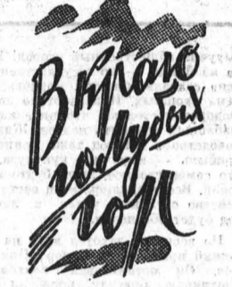
По проекту рабочего

Этот вечер был не совсем обычным. В клубе меланжевого комбината собрались мастера, передовики текстильщики с семьями.