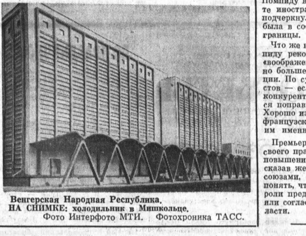
Венгерская Народная Республика. НА СНИМКЕ: ходячих в Милшколье. Фото Интерфото МТИ. Фотохроника ТАСС.

ПАРИЖ, 28 апреля. Корр. ТАСС Ю. Пономарев передает: Сигнал тревоги в полном смысле этого слова подал, обращаясь к французским предпринимателям, премьер-министр Ж. Помпиду.