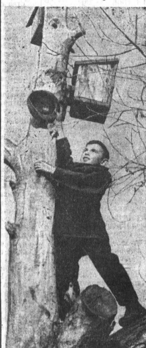
Скворцы прилетели.