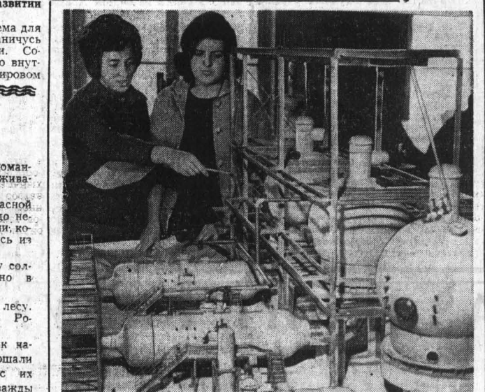
МОСКВА. Работники московского института «Нипрокаучук» ведут большую работу по созданию проектов десктонов новых прядильных машин.

Сорокинский район. Сорокинский район. Сорокинский район. Сорокинский район.