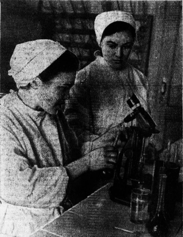
Работники агрохимлаборатории Топчихинского производственного управления до начала сева обязались произвести анализы почв всех хозяйств управления, а к началу сева будет выдана документация на наличие питательных элементов в почве и количества внесения недостающих удобрений.

Пополнилась «семья» химических предприятий Красноярского экономического района: неподалеку от железнодорожной станции Решеты вступил в строй новый завод — канифольный. Молодой коллектив канифольно-терпентинового производства с первых же дней выдал высокий трудовой темп. Уже выработано более 600 тонн канифоли и сто тонн скипидара.