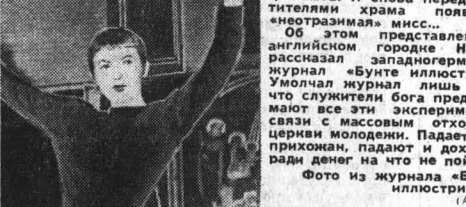
В церкви в Нью-Йорке. Преподобный Вернон Митчелл не дал спокойно спать новшества некоторых его коллег, прантинующих во время богослужения исполнение мировой легкой музыки.

И английский пастор решил пойти еще дальше. Он предложил приобщить к своему делу репертуар весьма разнообразной программой. В частности в черном трико позировала собравшаяся фотография на фоне кино (фото № 1).