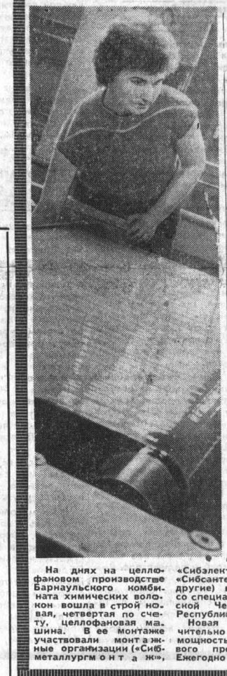
На днях на целлюлозно-бумажном комбинате химический завод вошел в строй...

Возьмем, к примеру, наш совхоз. В нынешнем году мы спланировали такую структуру посевных площадей, которая позволит полностью выполнить государственные задания и обеспечить внутрихозяйственные нужды. Разумеется, что достойное место от-