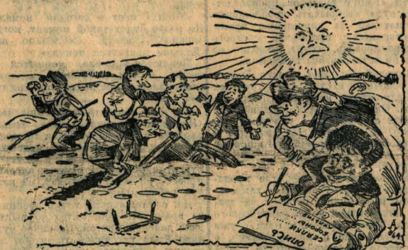
...Нашли! Все в порядке! Рис. А. Урюпина.

Итак, рейд, как и планировался, «проведен». Кто же осмелится утверждать, что прошел он бесследно? И. ЗАЙЦЕВ, Г. ЦЕЛМС, Камениское управление.