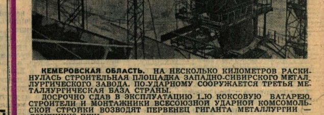
КЕМЕРОВСКАЯ ОБЛАСТЬ. НА НЕКОТОРЫЕ КИЛОМЕТРЫ РАСКИНУЛАСЬ СТРОИТЕЛЬНАЯ ПЛОЩАДКА ЗАПАДНО-СИБИРСКОГО МЕТАЛЛУРГИЧЕСКОГО ЗАВОДА. ПО-УДАРНОМУ СООБРУЖАЕТСЯ ТРЕТЬЯ МЕТАЛЛУРГИЧЕСКАЯ БАЗА СТРАНЫ.

Досрочно слав в эксплуатацию 1-ю коксовую батарею. СТРОИТЕЛИ И МОНТАЖНИКИ ВСЕСОЮЗНОЙ УДАРНОЙ КОМСОМОЛЬСКОЙ СТРОЙКИ ВОЗВОДИТ ПЕРВЕНЕЦ ГИГАНТА МЕТАЛЛУРГИИ — ДОМЕННУЮ ПЕЧЬ.