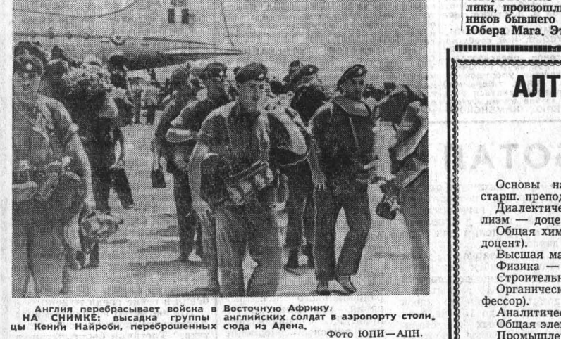
Англия перебрасывает войска в Восточную Африку. НА СНИМКЕ: высадка группы английских солдат в аэропорту столицы Кении Найроби, переброшенных сюда из Адена.